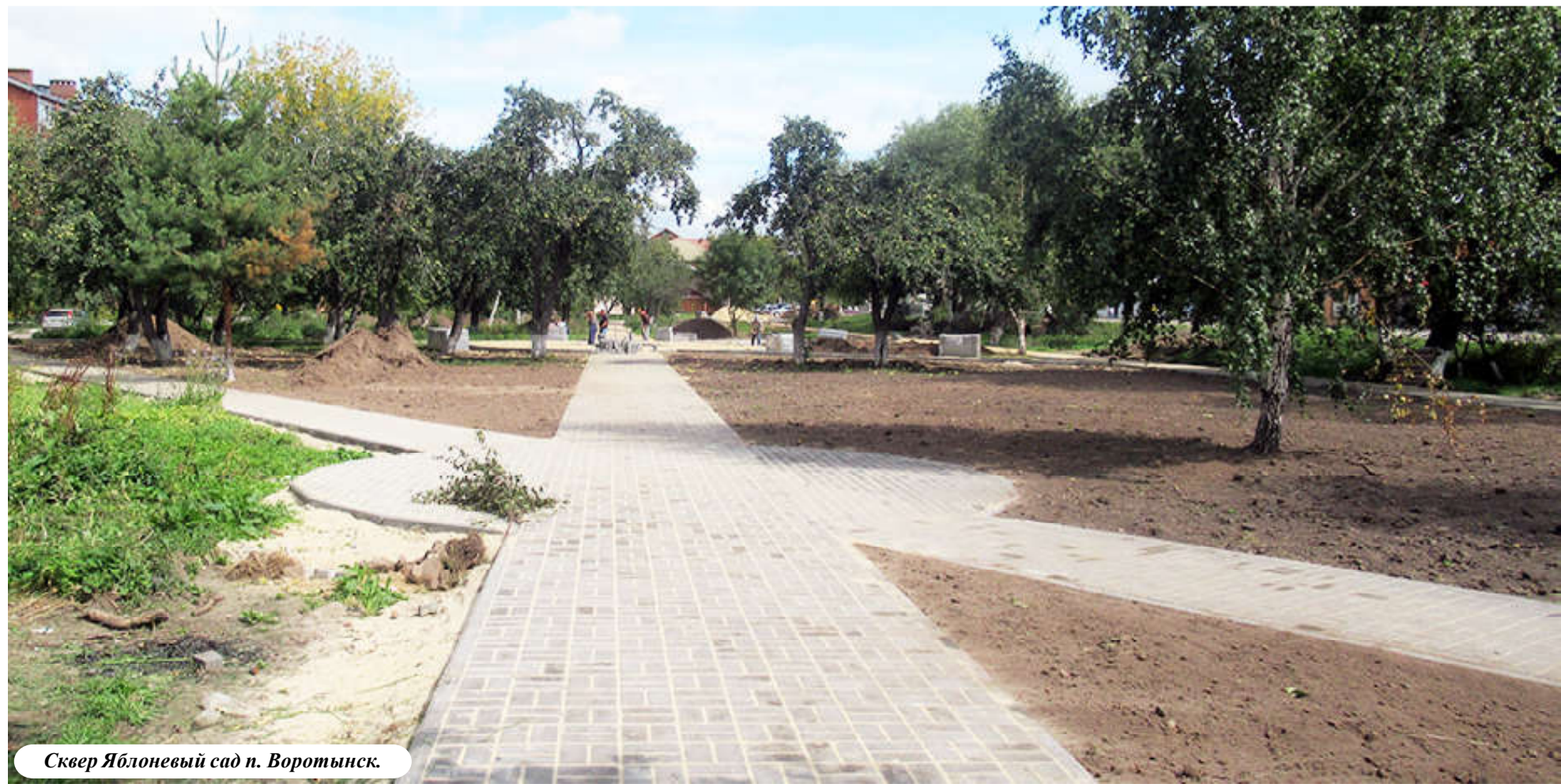
Сквер Яблоневоый сад п. Воротынский.

Материалы подготовила Л. ЕГОРОВА.