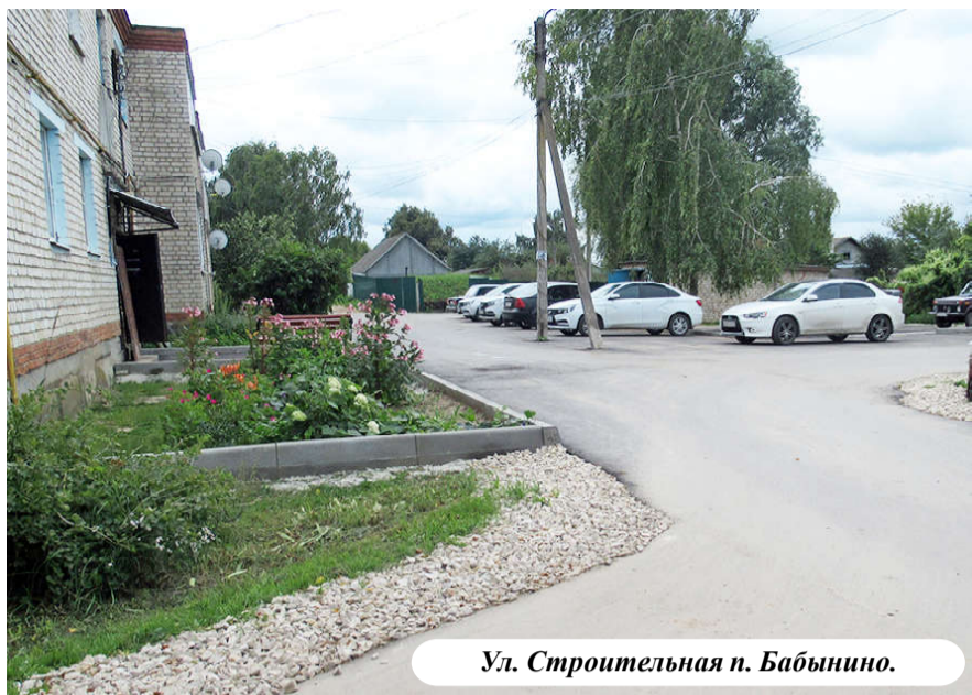
Ул. Строительная п. Бабынино.

Хочется сказать еще несколько слов об универсальной спортивной площадке в поселке Воротынский. Данный вопрос у населения «на устах» не первый год. Так вот целевые средства в сумме 4,6 млн. руб. на эту спортивную площадку также были выделены в прошлом году Воротынску после обращения администрации района в министерство финансов Калужской области.