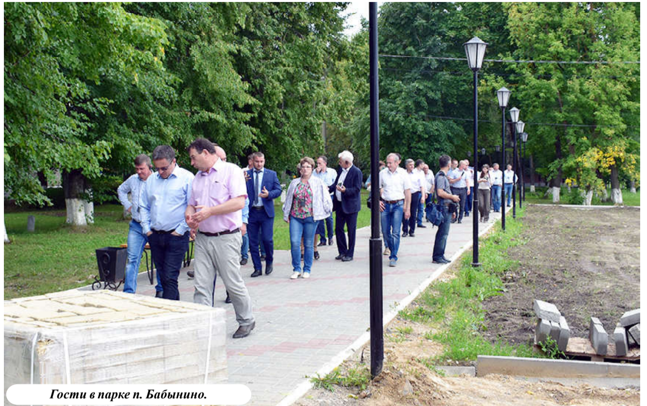
Гости в парке п. Бабынино.

В этом году район переживает настоящий благоустроительный бум!