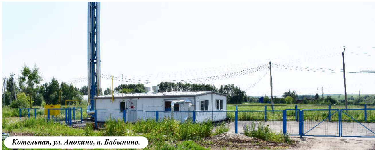
Котельная, ул. Анохина, п. Бабынино.

нального хозяйства поднимал этот вопрос, были также неоднократные письменные обращения о недостаточности средств на наши проекты. Нас услышали, просьба об увеличении субсидии была удовлетворена: у поселка Бабынино субсидия была увеличена с 0,9 млн. руб. до 3,7 млн. руб., а по поселку Воротынский с 2,9 млн. руб. до 9,3 млн. руб. На этих поселениях сейчас огромная ответственность – правильно, грамотно, а, главное, вовремя использовать данные целевые средства.