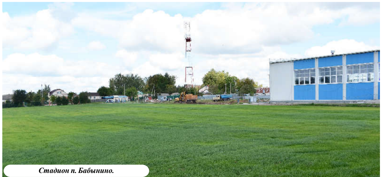
Стадион п. Бабынино.

Вот на этом этапе чаще всего встает вопрос о финансах, ведь без денег ни один проект нельзя реализовать. И если у муниципального образования задачи оказываются «неподъемными» и самостоятельно они не могут их решить, тогда в процесс включается район. Для этого гото-