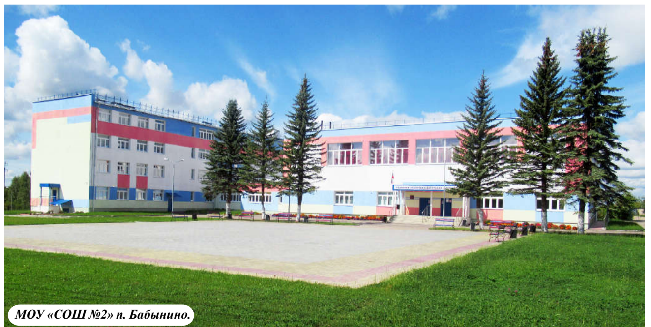
МОУ «СОШ №2» п. Бабынино.