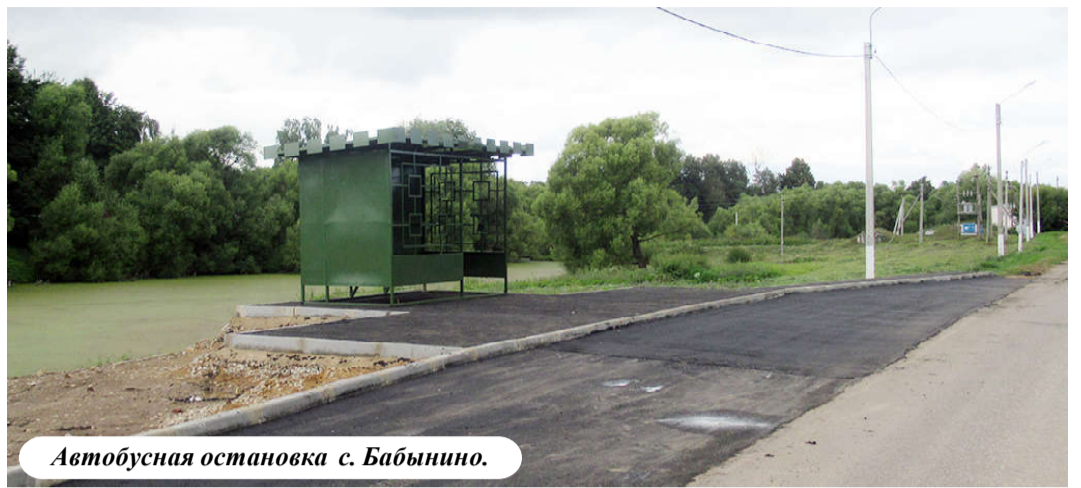
Автобусная остановка с. Бабынино.

В этом году нами проведена большая работа по наведению чистоты в насе-