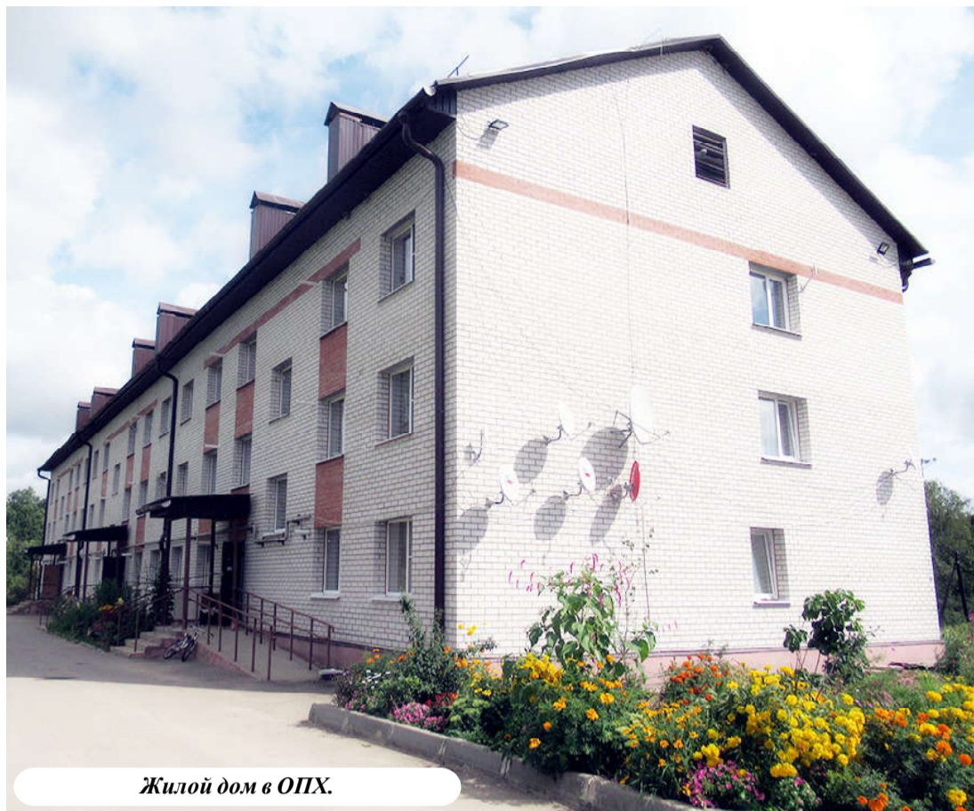
Жилой дом в ОПХ.

Совсем недавно мы смогли установить на въезде в с. Муромцево автобусную остановку, что стало большой радостью для его жителей. Мы долго этого добивались: строительство авторазвязки, обновление трассы привели к тому, что остановка оказалась далеко от «входа»