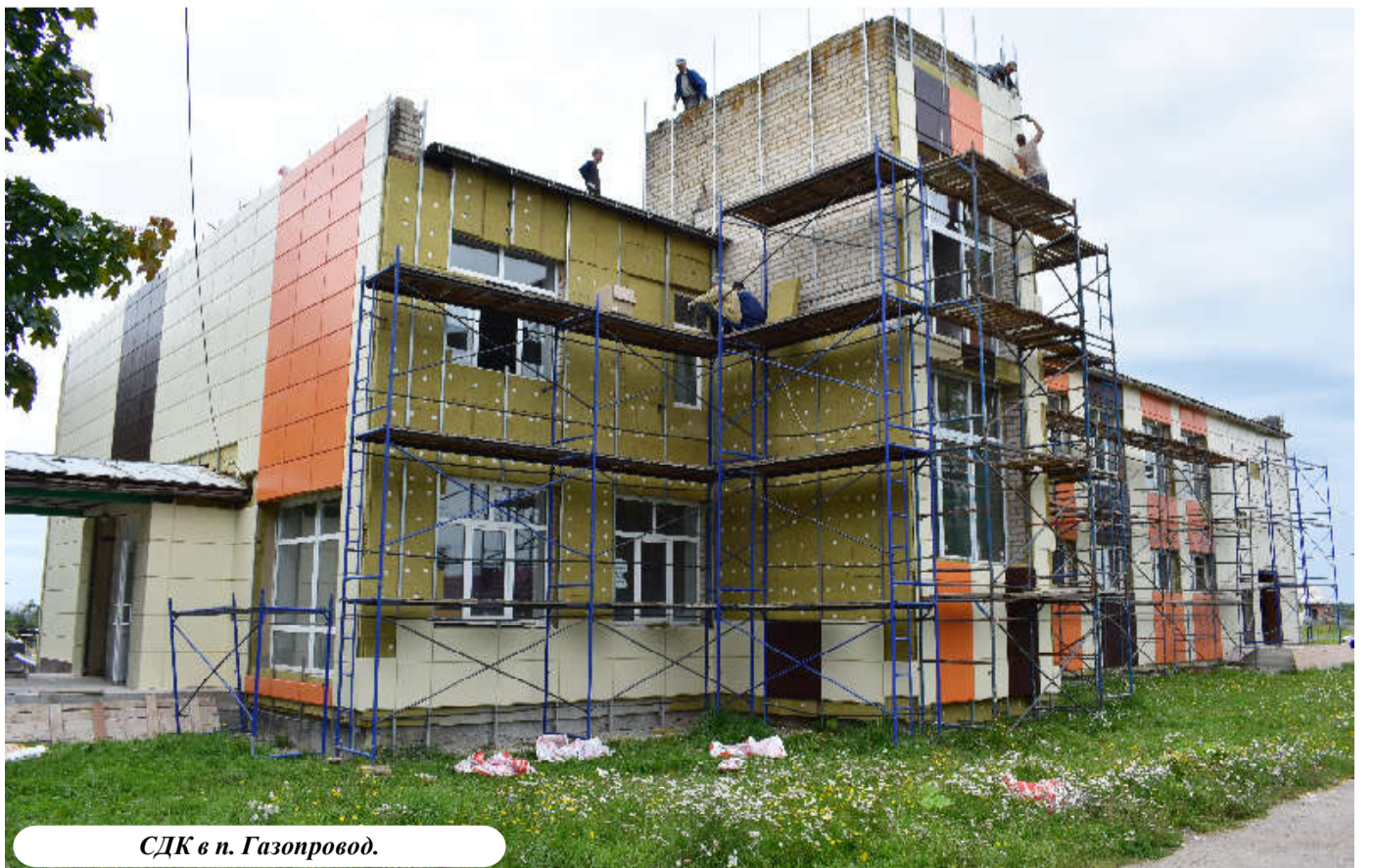
СДК в п. Газопровод.

Хочется, конечно, чтобы в Сабуровщине появились очис-