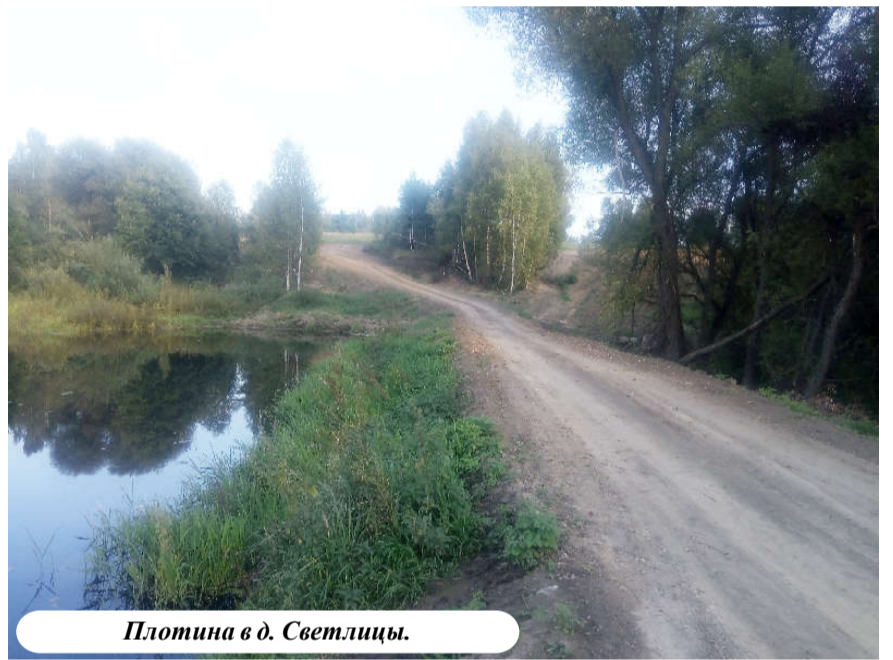
Плотина в д. Светлицы.

Что касается внутрипоселенческих дорог, то стараемся